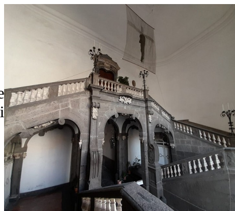
Palazzo Serra di Cassano e l'Istituto di Studi Filosofici