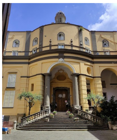
La chiesa di Santa Maria Egiziaca