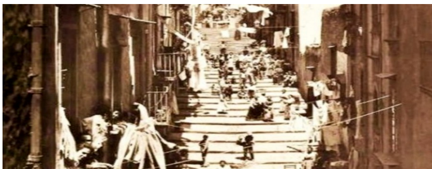
Il Pallonetto di Santa Lucia e la chiesa di Santa Maria della Catena