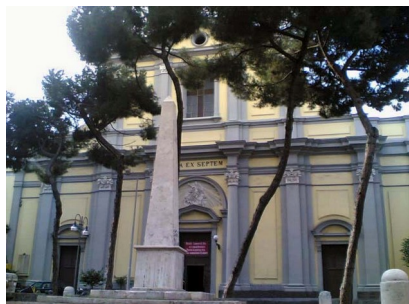
La chiesa di Santa Maria degli Angeli